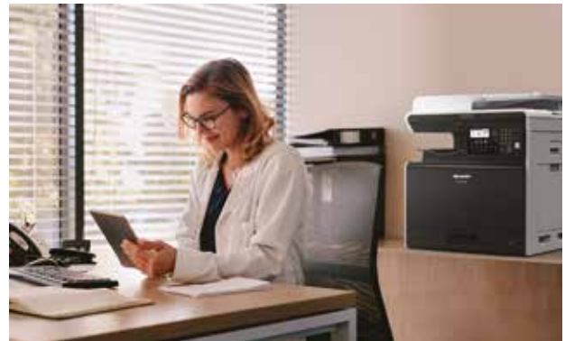
Een stijlvolle aanvulling op elke kantooromgeving.

U hebt niet langer te maken met complexe opstellingen of rommelige kabels. Dankzij de optionele draadloze LAN kunt u elk WiFi-compatibel apparaat aansluiten, zodat iedereen direct vanaf zijn smartphone, tablet of PC kan afdrukken of scannen met behulp van AirPrint, Google Cloud Print of de app Sharpdesk Mobile. Of u steekt een USB-stick in de MFP en selecteert eenvoudig een bestand uit het pop-upmenu, om direct opgeslagen documenten af te drukken, of scans op te slaan zonder dat u daarvoor een PC nodig hebt.